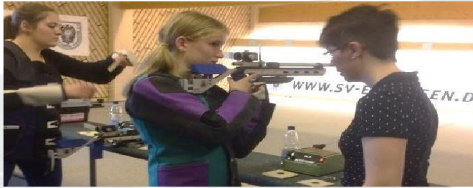
Jugendausbildung mit dem Luftgewehr