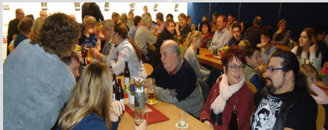
Gesellige Veranstaltungen: Jahresabschlussfeier