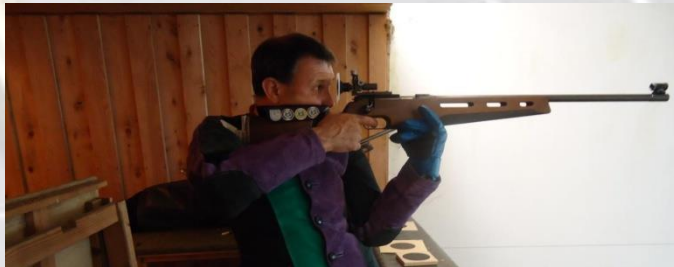
Schießen mit dem KK- Gewehr