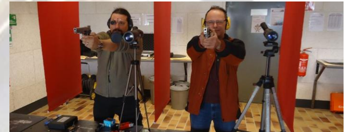
Schießen mit Kurzwaffen