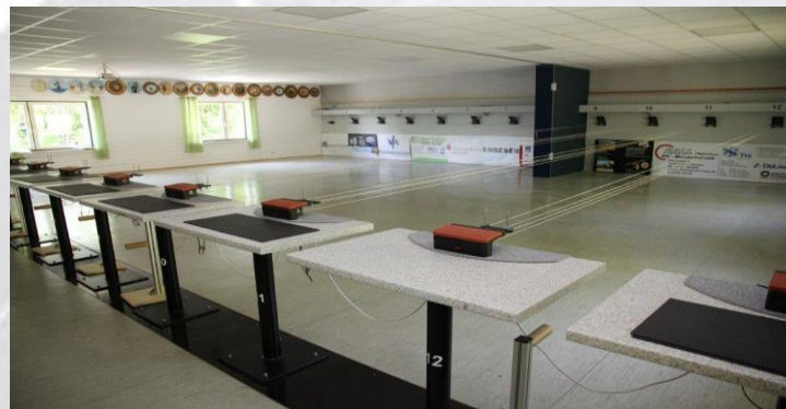
13 Luftdruckwaffenstände (10m, 7,5 Joule)