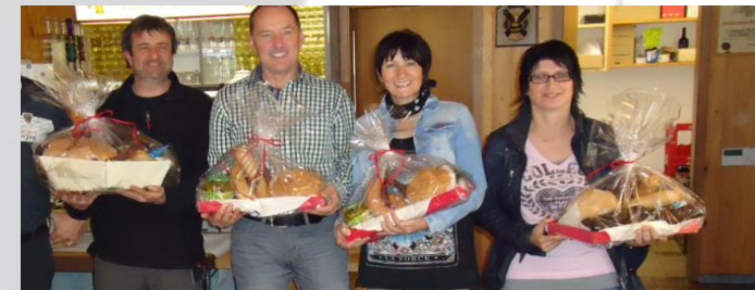
Gesellige Veranstaltungen: Räuber Cup