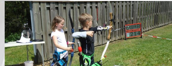
Jugendausbildung mit Pfeil und Bogen