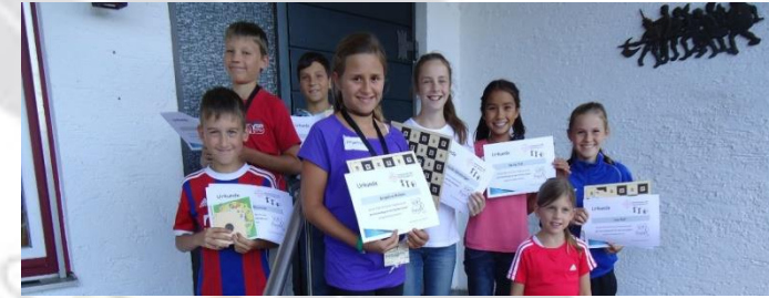
Kinder beim Sommerkinder Ferienprogramm