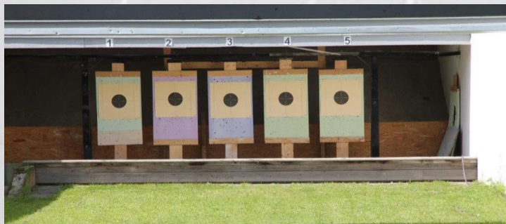
5 Kurzgewehrstände (25m, 1.500 Joule)